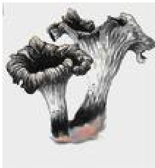
(Trompette de la mort)

Photographiez-les... mais ne les mettez pas dans votre bouche, même si vous êtes certains qu'il est bon. On ne doit pas courir de risque.